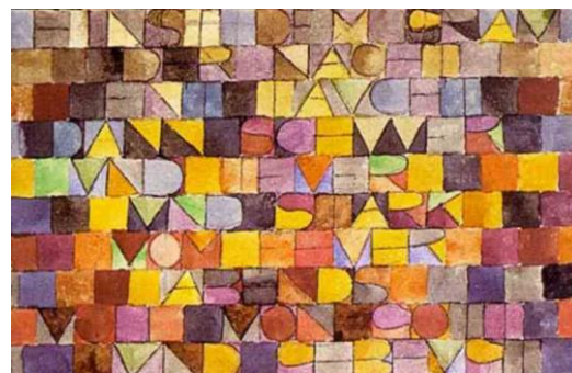
Paul Klee, Dapprima innalzatosi dal grigiore della notte , 1918

Sala Monicelli, Centro Benedetta D'Intino, Milano